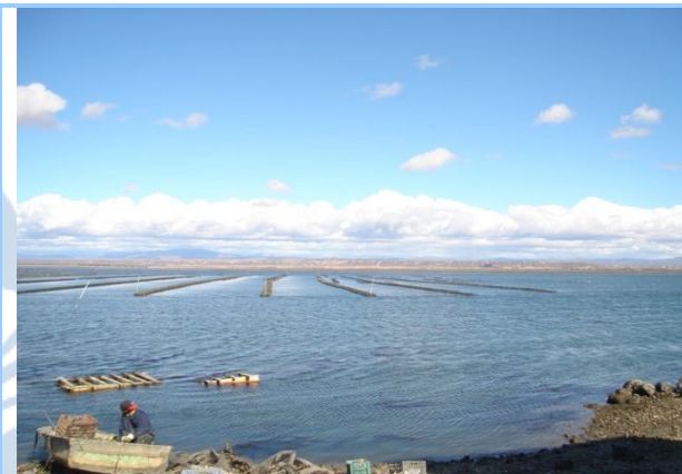
Área de cultivo.