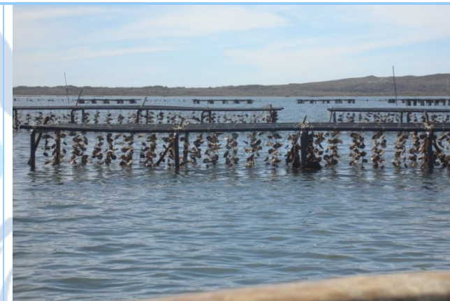
Área de cultivo.