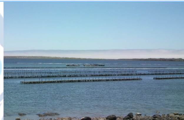
Área de cultivo.

Localizada en Bahía Falsa, B.C., pioneros de la ya extinta SCPP Bahía Falsa. Registrada desde el año 2001, cuenta con una concesión con vigencia de 20 años para cultivo semintensivo de ostión en estantes.