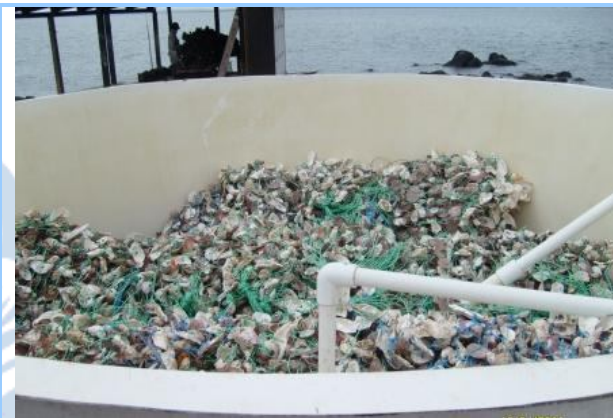
Posta de fijación.