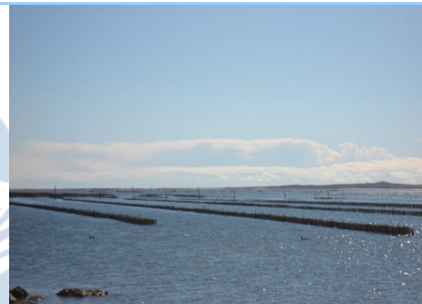
Área de cultivo.