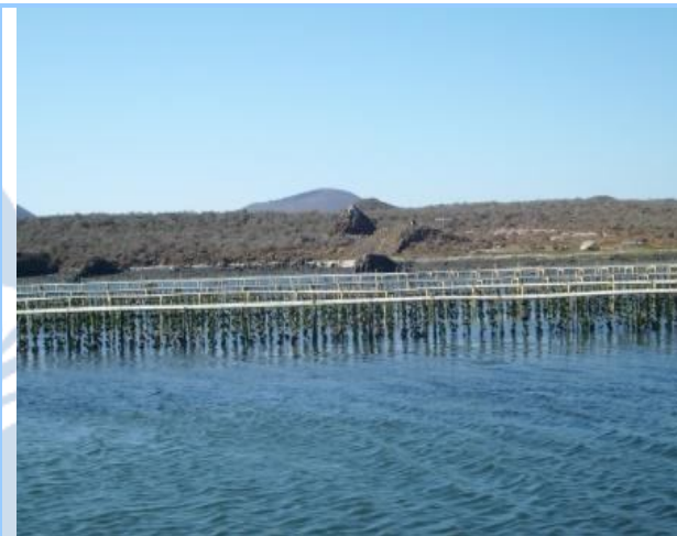
Área de cultivo.