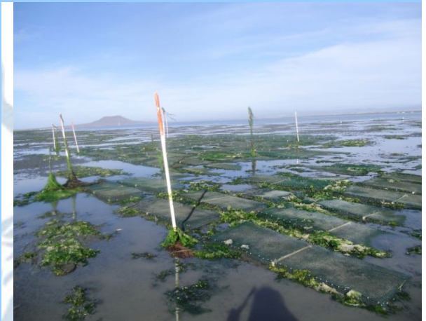
Área de cultivo.