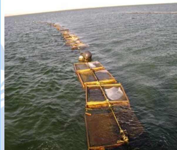
Área de cultivo.