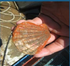
Almeja mano de león