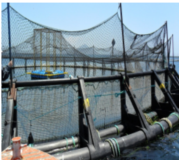
Figura 2.- Jaula de engorda de la empresa Pacifico Aquaculture.