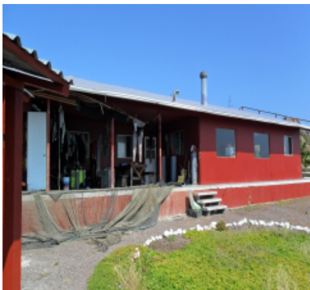
Figura 3.- Instalaciones de la empresa Pacifico Aquaculture que se encuentran en la Isla de Todos Santos.